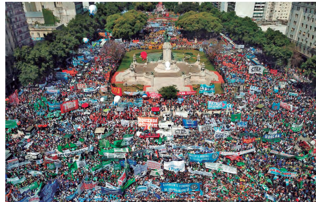
Una multitud se concentró el 29 en la Plaza del Congreso contra el ajuste del gobierno