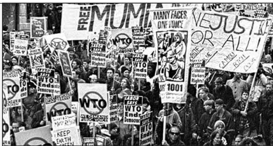
Marcha repudiando a la OMC en 1999 en Seattle -Estados Unidos-, que dio comienzo al movimiento antiglobalización

Hasta ahora las discusiones en la OMC giraron, básicamente, alrededor de los subsidios agrícolas. Más allá de las contradicciones entre los Estados Unidos y la Unión Europea al respecto, el conjunto de los países capitalistas imperialistas exigen,