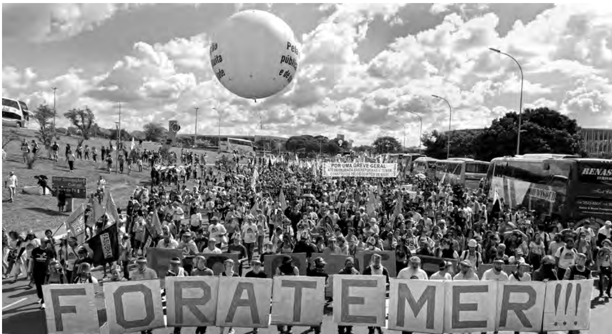
Movilizaciones contra Temer y su ajuste

En medio del ataque del gobierno de Temer contra los trabajadores -ya aprobó la ley de flexibilización laboral y ahora intenta una ley de jubilaciones que anula para muchos hasta la posibilidad de jubilarse- y frente a la presión de las bases las centrales sindicales convocan a una huelga general para el 5 de diciembre.