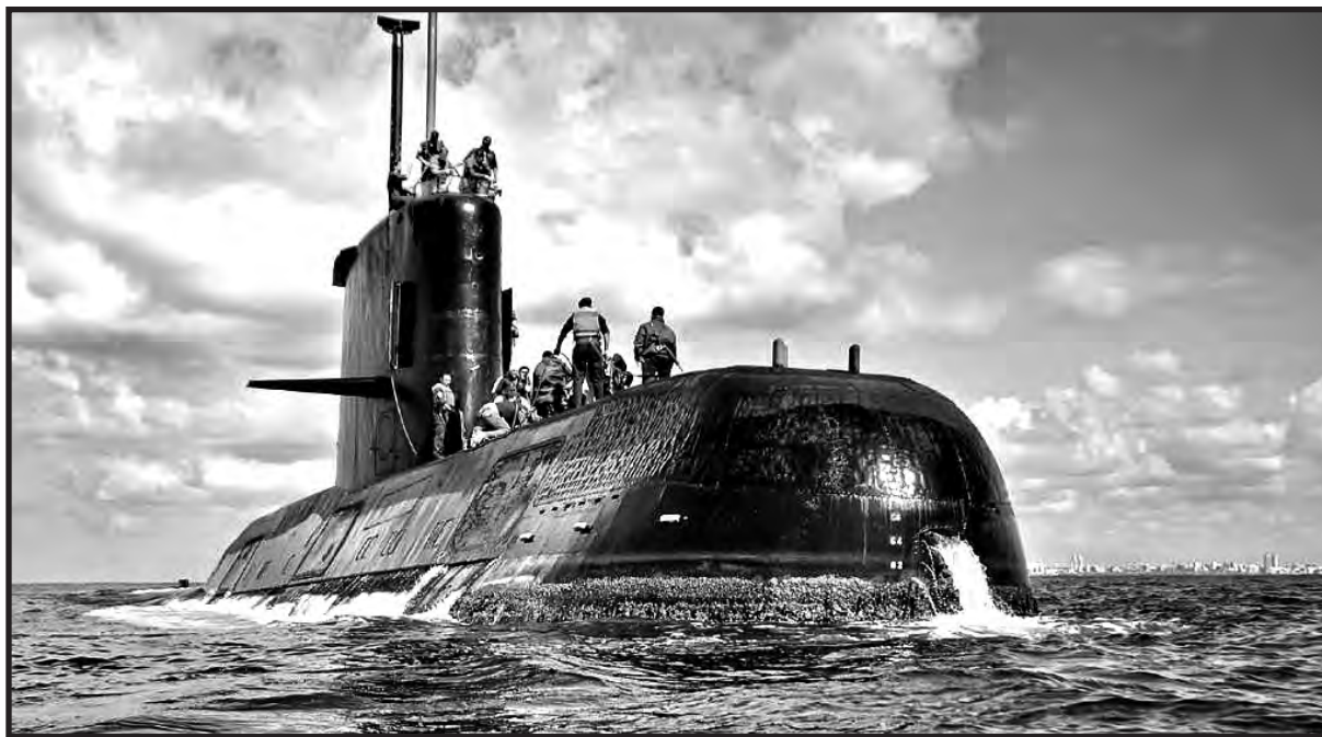
La corrupción y la desidia tuvieron su parte en esta nueva tragedia evitable

Hubo una manifiesta irresponsabilidad, desprecio por la vida hu-