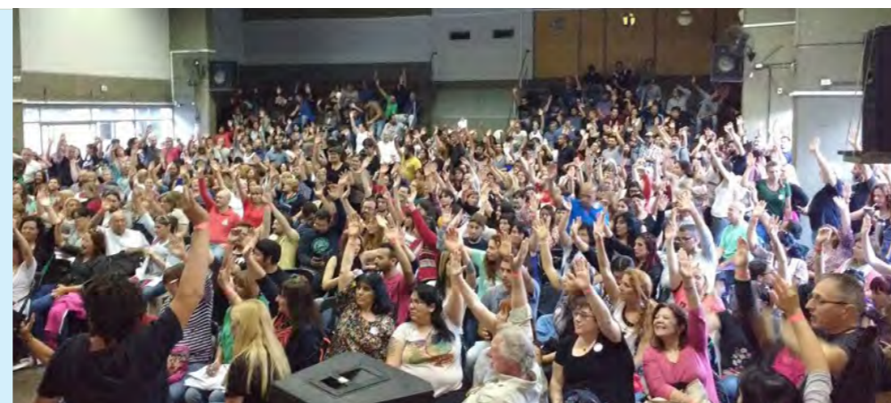
Votación del Suteba La Matanza a favor de las movilizaciones del 29 de noviembre y el 6 de diciembre

Termina el año y los problemas salariales, de infraestructura,