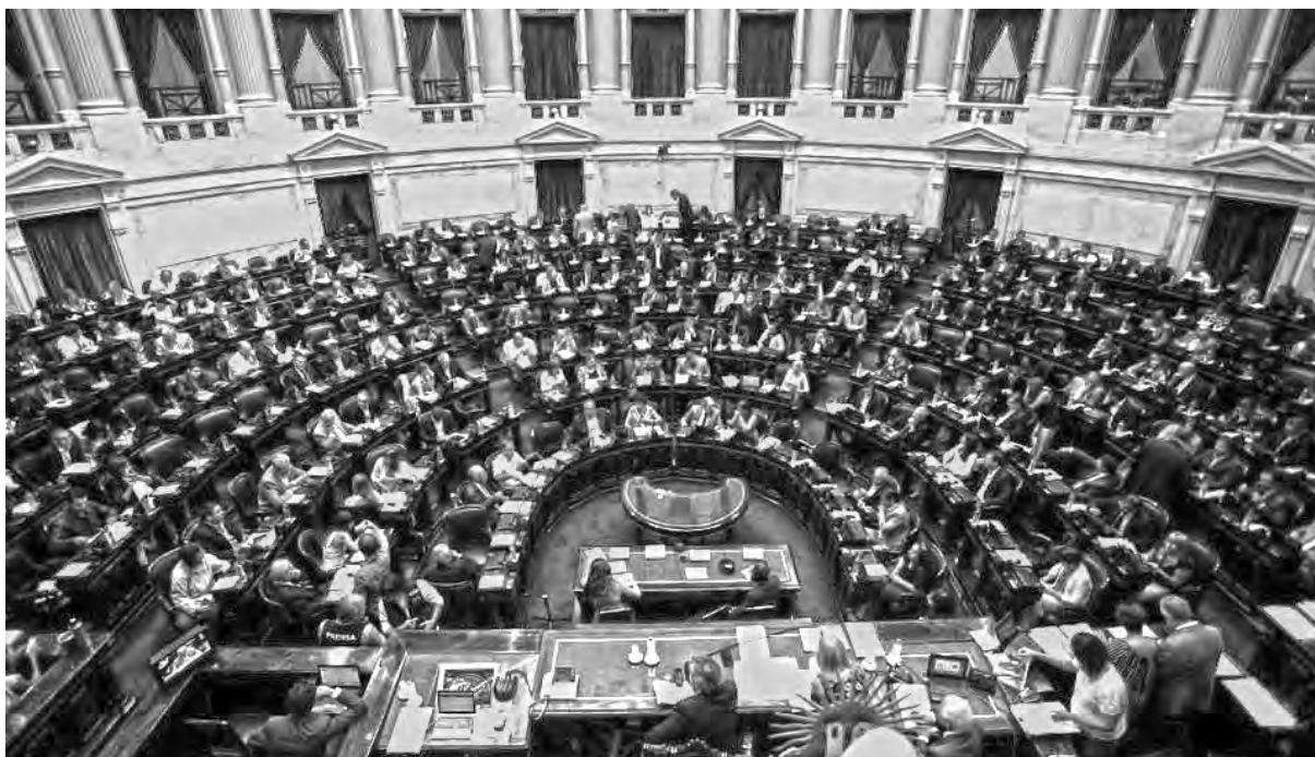
De los partidos patronales no saldrán leyes que favorezcan a las mujeres

La ley que se aprobó es más restrictiva que la actual. Hoy se pueden presentar listas electorales con hasta un 70% de mujeres (el cupo actual es de un mínimo de 30%). Es lo que hace el Frente de Izquierda. Pero, de ahora en más, el techo será del 50% en vez del 70% actual. Quiere decir que si PRO, la UCR, la Coalición Cí-