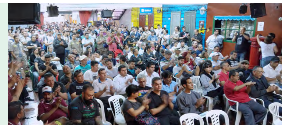
Combativa asamblea ferroviaria

Se planteó que la convocatoria al Congreso Nacional para el 29 de noviembre es una oportunidad para comenzar a construir esta imprescindible