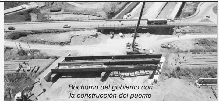
Bochorno del gobierno con la construcción del puente

Papelón en Luján Puentes ferroviarios más angostos que los trenes